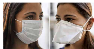
Masque chirurgical Masque FFP2

Le port d'un masque poursuit 2 objectifs : soit limiter la dispersion des BK dans l'air, soit empêcher que ceux-ci ne soient inhalés. Dans le premier cas un simple masque chirurgical suffit alors qu'un masque respiratoire est nécessaire pour agir comme barrière contre l'inhalation des BK. Pour une question pratique il a été décidé que les cas suspects/malades et les personnes nécessitant une protection porteraient le même type de masque respiratoire FFP2.